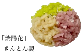
「紫陽花」 きんとん製