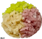
「紫陽花」 きんとん製